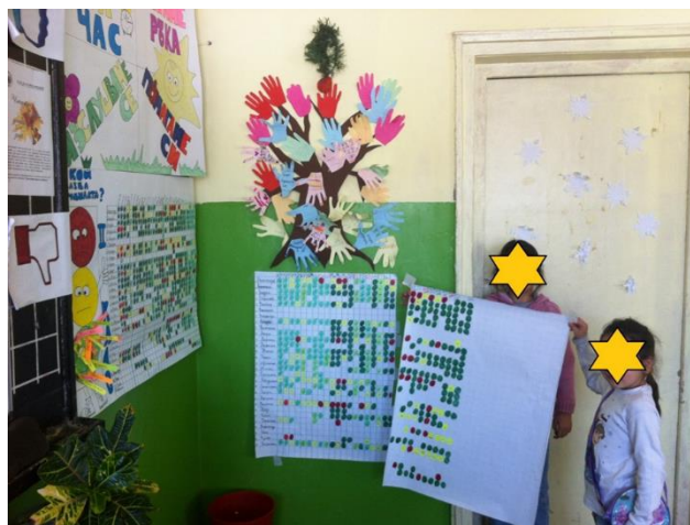
Фиг. 1. Тракер за поведение „Светофар – Кой спазва правилата?“

Поведението на децата се регулира и визуализира чрез тракер – светофар с техните имена, написани на лепящи листчета: