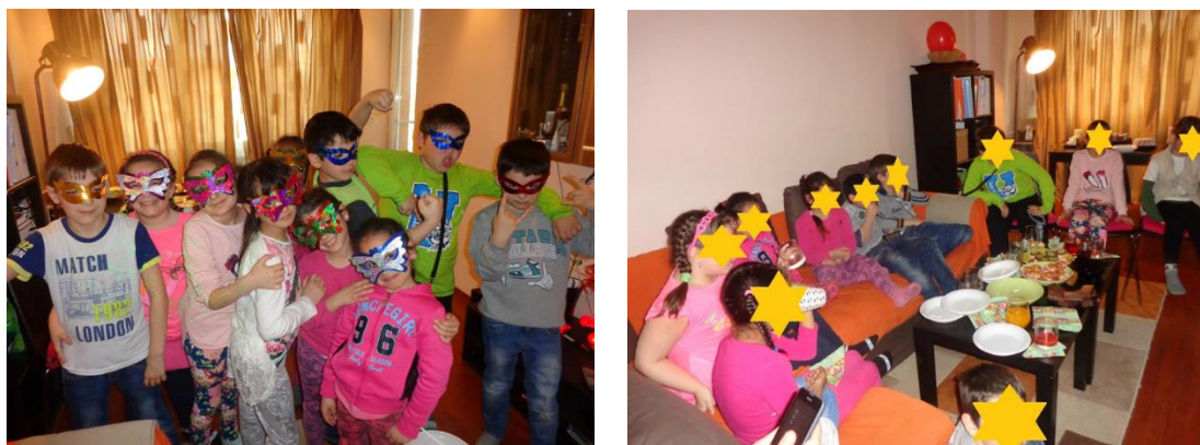
Фиг. 2. Голямата награда „На гости у госпожата” за спазвалите отлично поведение 6 поредни седмици

След направеното проучване на литературните източници по проблема, се подбра подходящ диагностичен инструментариум, а именно тестът на Рене Жил. Представят се само резултатите от Скала № 11 „Конфликтност, агресивност”, поради темата на настоящото изследване.