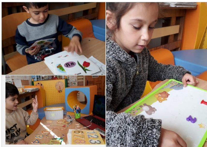
Фиг. 2. Моделиране на цифри и букви с помощта на макарони

След приключване на тази дидактична задача, следващата задача с която запознава ресурсният учител ученика е моделиране на цифри и букви с помощта на макарони с формата на малки тръбички, които трябва да бъдат нанизани на меки плюшени пръчици дълги около 20 см. Ученикът има достатъчно време да изработи зададената му от учителя цифра/буква по шаблон. Когато е готов поставя под нея цифра/буква от вградителя, която е същата, като изработената от него. Това се прави с цел ученикът да може да направи връзката с прототипа на цифрата/буквата, която е изработил и тази от вградителя - шаблон.