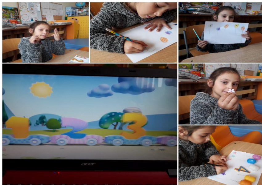
Фиг. 1. Запознаване на числа и букви с помощта на техническо средство и подходящи дидактически материали

балона в различен цвят. След което то поставя под всеки балон цифричката/буквичката, която е изписало в съответното балонче.