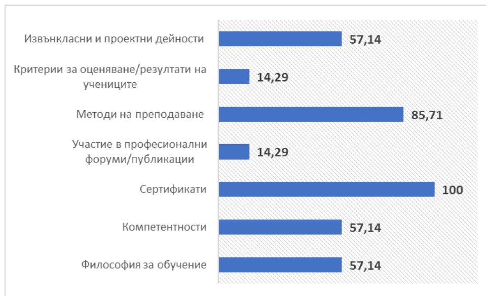
Диаграма 1. Честота на повторяемост на индикаторите в изследваните професионални портфолия

индикатори на проучването, които според тяхната честота на повторяемост в изследваните професионални портфолия са визуализирани на Диаграма 1.