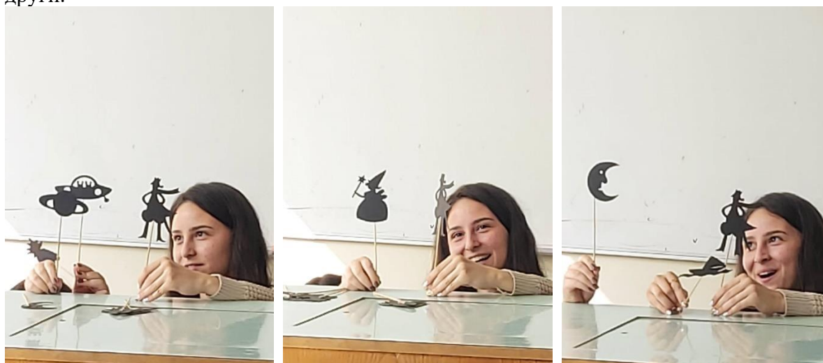
Фигура 4. Изображение на задача „Театър на сенките“

Цел: проектът е възможност да се изследва личната сила и личната идентичност. Приказната история като педагогически инструмент се използва широко обхватно, като се отработва и изследва начинът за общуване, различни модели на поведение. Задачата съдържа разнообразни възможности за разкриване и повлияване върху емоционални усещания, подсъзнателна информация, вътрешни преживявания и ресурси за справяне. Чрез приказките могат да се постигнат редица педагогически задачи, като отработване на негативни емоции, преодоляване на неприемливо социално поведение и реакции, и други.