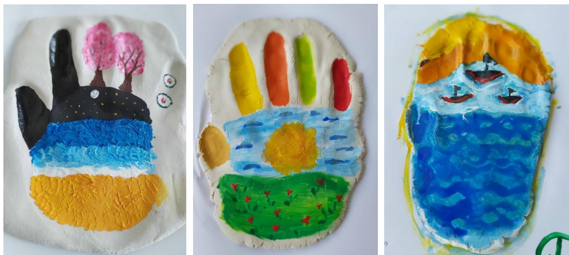
Фигура 3. Изображение на задача „Карта на моето вълшебно пътешествие“

Цел: проектът е възможност да се изследват бъдещи желания, мечти и прозрения. Възможно е да се изследват значими за участника места, хора, събития. Могат да се открият методи за постигане на удовлетворение и благополучие [5].