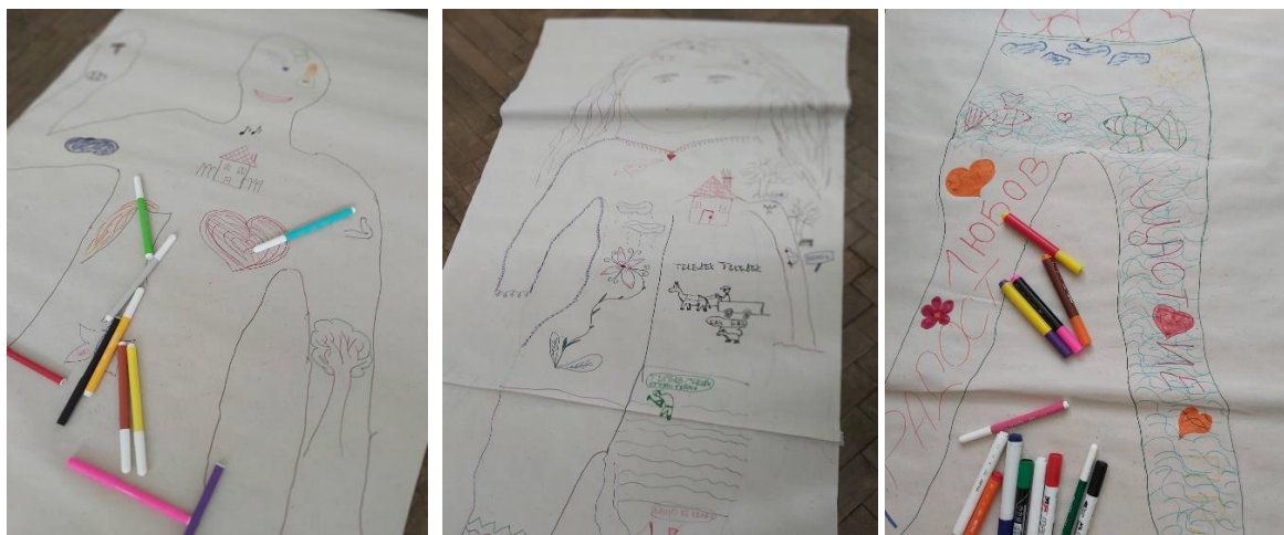
Фигура 1. Изображение на задача „Очертаване на тялото – какво чувствам вътре“

Цел: проектът е възможност изпълняващият да придобие осъзнаване на тялото. Да получи свързване на физическите усещания с емоциите, с тяхното изразяване и евентуални усещания или скрити послания, които са „записани“ в тялото. Може да се изследва самочувствието, „имиджа“, както и личните граници. Задачата е подходяща и за деца, преживели медицинска интервенция, физическа или емоционална травма, както и за хиперактивни деца [4].