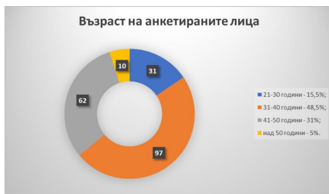
Фигура 2. Възраст на респондентите

Отношението на студентите към съдържанието на изучаваната дисциплина е важно да се проучи, защото практиката показва доста противоречиви данни. За щастие не малък брой от бъдещите педагогически специалисти споделят нагласа да бъдат наистина приобщаващи учители и ясно осъзнават необходимостта от гъвкава и адекватна образователна система, която отговаря навременно и разумно на потребностите на учениците. Други студенти възприемат дисциплината като всяка друга и се стремят да се представят задоволително през семестъра, както и по време на изпитната сесия, за да получат очакваните резултати от оценяването. Има и студенти, които не се ангажират с теорията нито професионално, нито емоционално, с убеждението, че тяхната практика