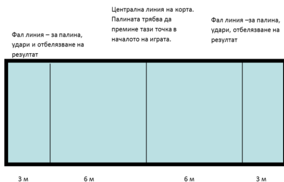
Фигура 2. Измерение на корт боче

Средна ограничителна линия - 9 метра от началото на игрището, минималното разстояние, на което е поставена палината за игра. По време на самата игра позицията на палината може да се изменя, за да се нормализира играта ( Фиг.2 ).