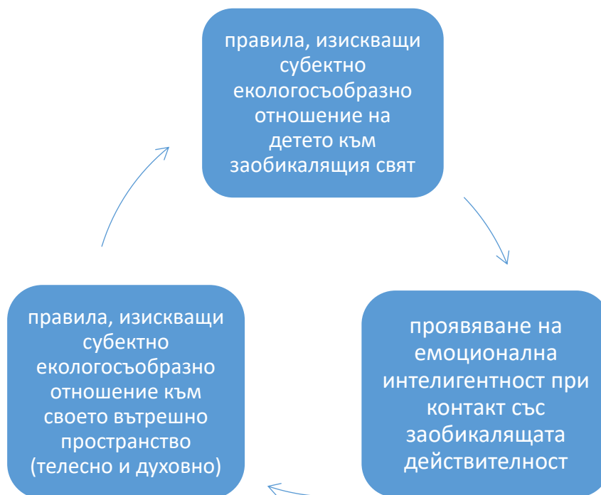
Фигура 5. Екологическа компетентност – трети компонент

екологосъобразни правила при взаимоотношението „човек – заобикаляща среда” (природна, жилищна, социална) (фиг. 5).