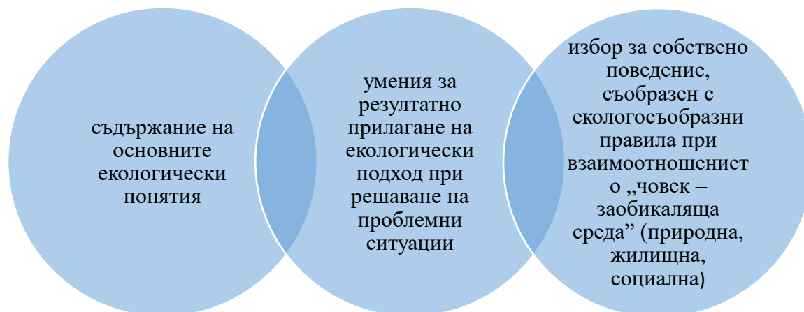
Фигура 2. Структура на екологическа компетентност в предучилищна възраст

Приемаме тези определения за екологическа компетентност , които разглеждат във взаимна връзка „екологическа компетентност – екологосъобразен подход към действителността”. Структурата на екологическата компетентност в предучилищна възраст обхваща три отделни, взаимосвързани, компонента (фиг. 2).