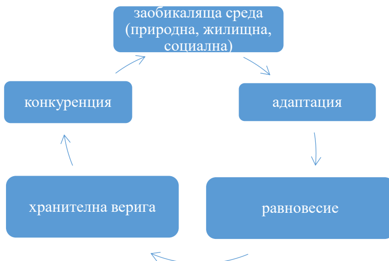
Фигура 3. Екологическа компетентност – първи компонент

Вторият компонент от структурата на екологическата компетентност в предучилищна възраст включва умения за резултатно прилагане на екологически подход при решаване на проблемни ситуации (фиг. 4).